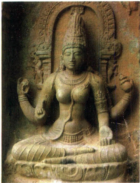
Saraswathi - சரஸ்வதி