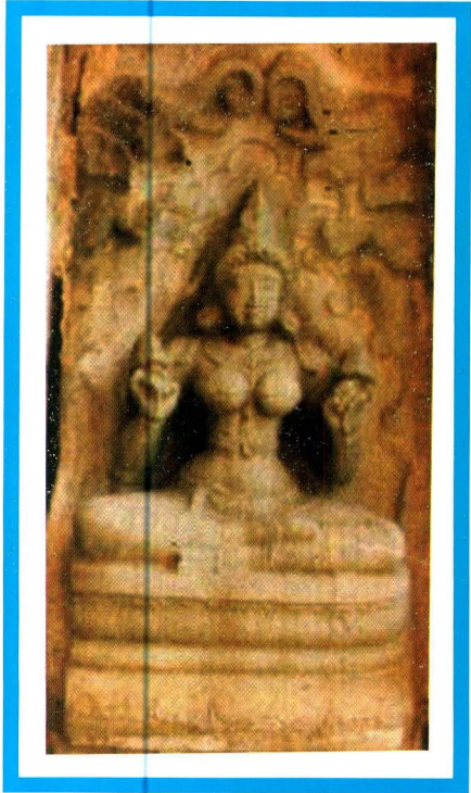
LAKSHMI - திருமகள்