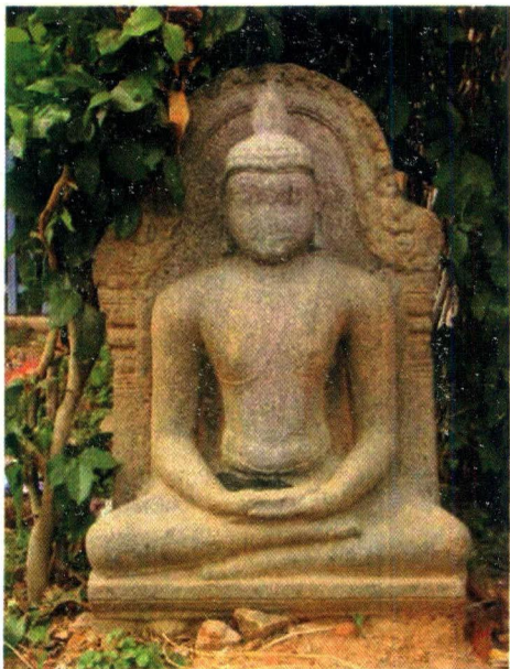
BUDDHA - புத்தர்